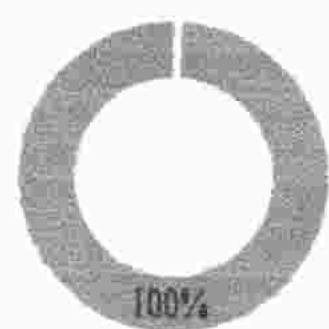
Cumplimiento Gestión EPP